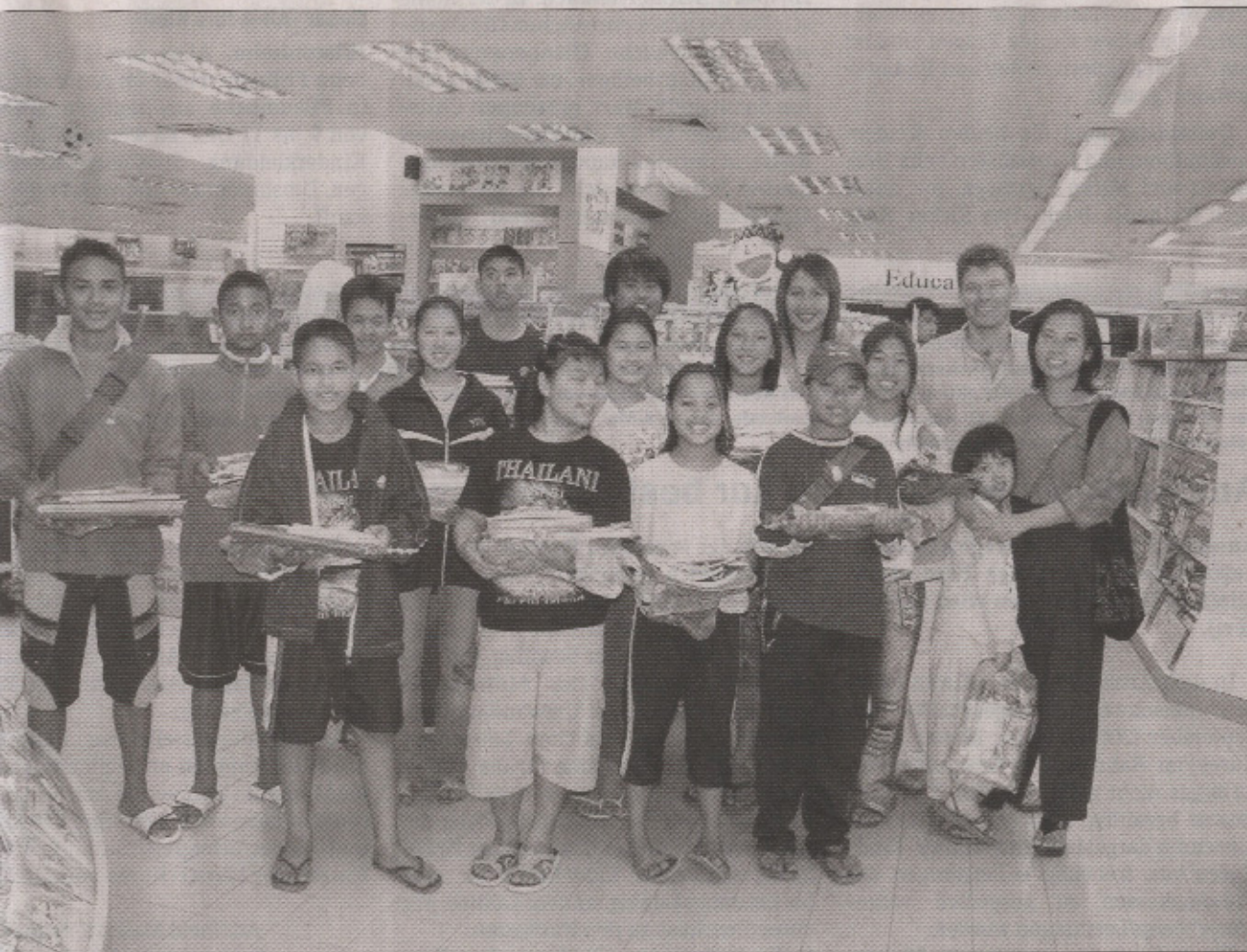
Aids-, Sozial- und Tsunami-Waisenkinder haben in der »School for Life« in Thailand ein neues Zuhause gefunden. Mit Geldern aus Sailauf wurden neue Schulbücher gekauft und eine Wasserpumpe repariert.